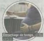
Davantage de temps

Le ministre des Classes moyennes, des Indépendants et des PME, Willy Bossus (MR), a présenté lundi un plan pour l'entrepreneuriat féminin, à la veille de la Journée internationale de la femme. Le coût de maternité des indépendantes doit notamment passer de 8 à 12 semaines. Les femmes indépendantes seront par ailleurs exemptées du paiement des cotisations sociales pendant le trimestre qui suit l'accouchement. Le coût de maternité des indépendantes comprendra toujours trois